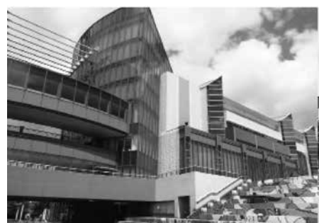
大阪南港 ATCホール入口(左)と建物全景(右)