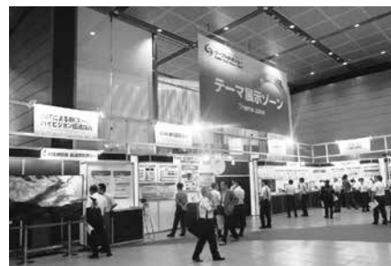
会場入口付近に設けられたテーマ展示ゾーン

伊藤忠ケーブルシステム(株)、共信コミュニケーションズ(株)、ソニービジネスソリューション(株)、(株)テクノハウス、(株)朋栄、リーダー電子(株)