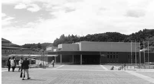
仙台国際センター展示棟 青葉山コンソーシアム