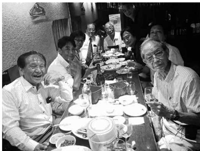
新宿「ごまや」にて暑気払いも兼ねて行なわれた第1回目のミーティング

②ブローシャ：大竹新理事長の挨拶文を中心に、各委員会の活動内容も一新し、英文の説明をなくして写真を多数入れる。