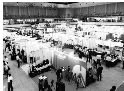
福岡国際センターの 2 フロアを使用して行なわれ、思考を凝らして見どころの多い同展

なお、同展開催前や開期中に西日本を襲った台風と豪雨の影響で、主流の来場者と思われる西日本の放送局では緊急報道体制を敷いていたとみられ、残念ながら本年の来場者は、2,278 名とのことであった。